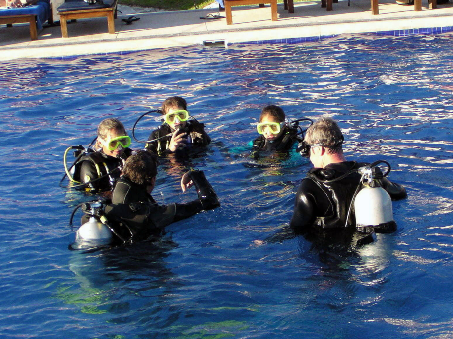
Due momenti chiave dell'attività subacquea ricreativa: a sinistra, la frequentazione di un corso di livello base e a destra, l'escursione guidata e organizzata da un diving center.