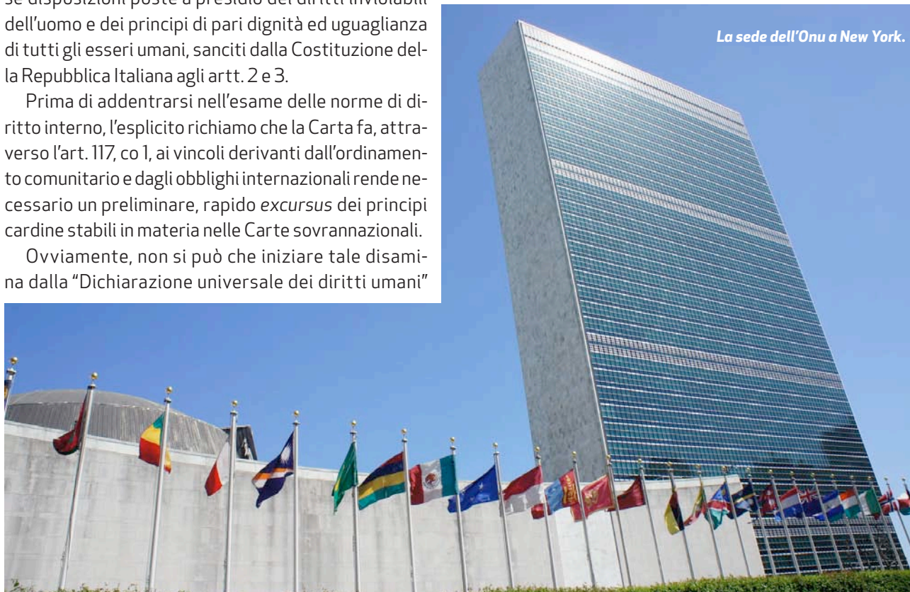
La sede dell'Onu a New York.