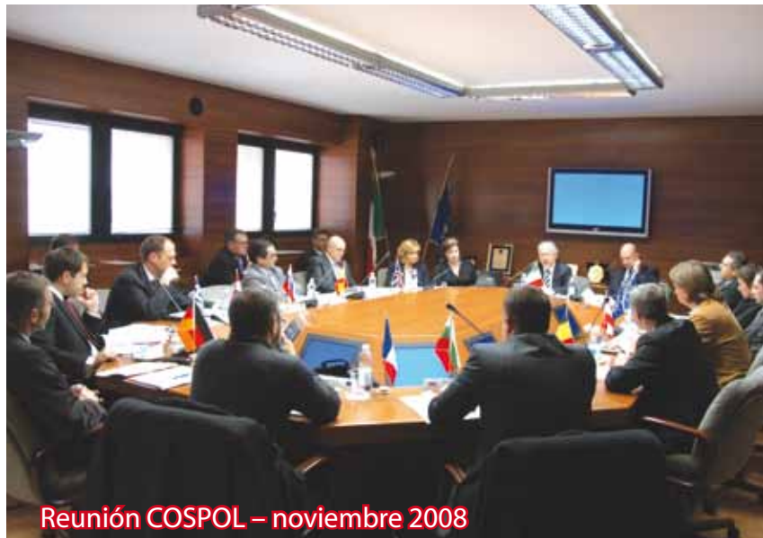
Reunión COSPOL – noviembre 2008

La Dirección Central para los Servicios Antidroga, interviene en las actividades de los siguientes grupos de