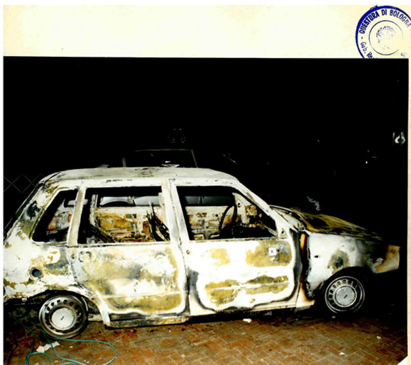
nr. 1)- L'autovettura Fiat Uno targata BO 981150, vista dal suo lato destro. Le lettere "X" e "Y" contrassegnano, rispettivamente: il foro nello sportello e l'ammaccatura sul battente dello stesso.-