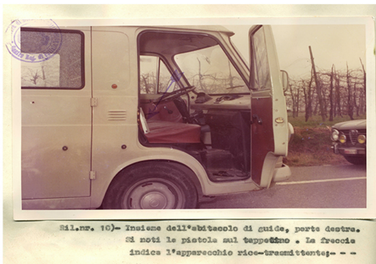
Ril.nr. 10)- Insieme dell'abitacolo di guide, porte destra. Si noti la pistola sul tappetino . La freccia indica l'apparecchio rice-trasmittente:- - -