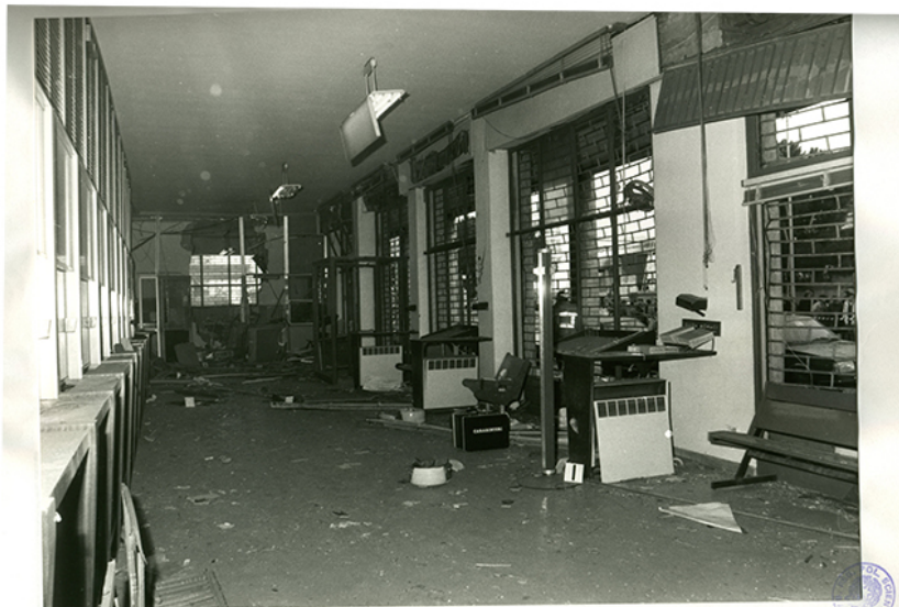
Ril. nr. 14 : Panoramica dell'Ufficio Postale, vista con le spalle rivolte alla parete posteriore.

I responsabili di questi ed altri efferati delitti commessi negli anni successivi tra Bologna e la Romagna, noti come i componenti della " Banda della Uno Bianca ", furono arrestati nel 1994 e successivamente condannati: tra di essi c'erano appartenenti alla Polizia di Stato.