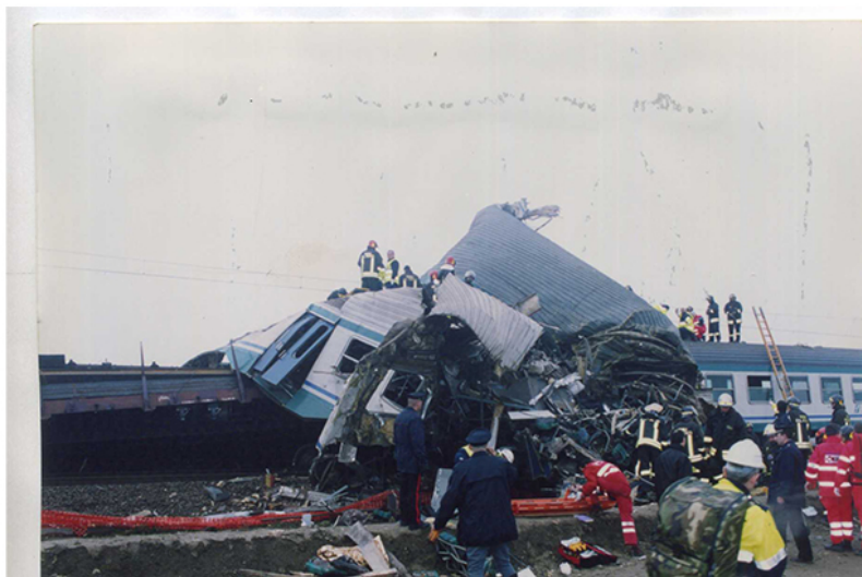
Ril.nr.20: Veduta parziale della vettura viaggiatori nr.5083-2187451-5, con la parte anteriore schiacciata, delle vetture viaggiatori nr.5083-2187042-4 e nr.5083-2187042-4 completamente divelte ed esplose, posizionate trasversalmente rispetto alla linea ferroviaria e poggiate sul carro pianale nr.3183-3558054-0.

L'impatto provocò 17 morti e diverse decine di feriti.