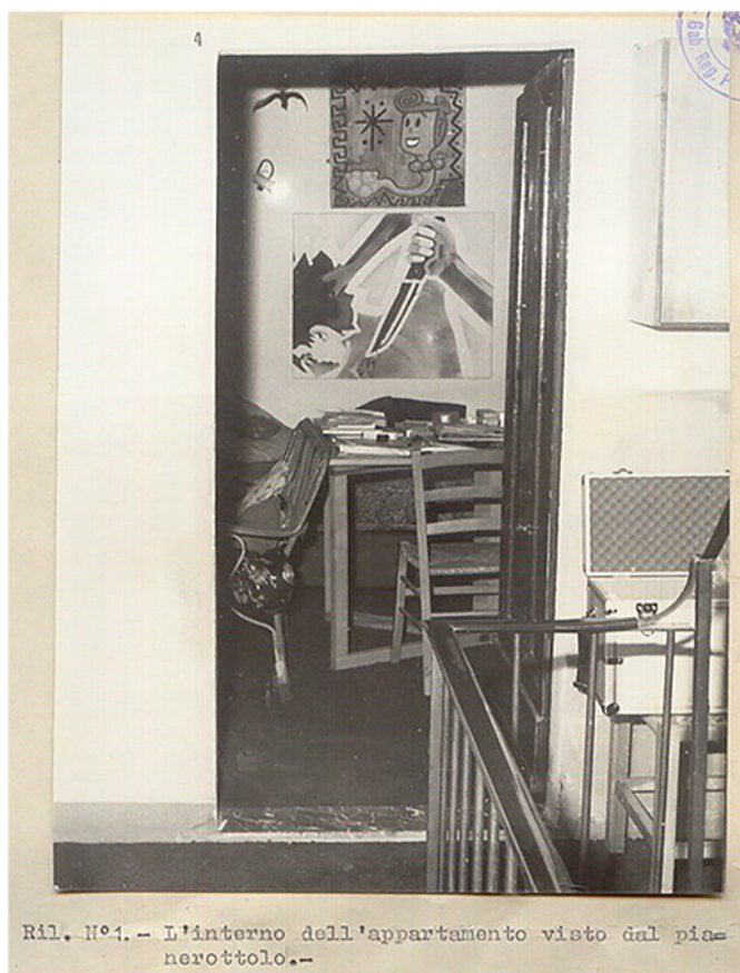
Ril. N°4.- L'interno dell'appartamento visto dal pianerottolo.-