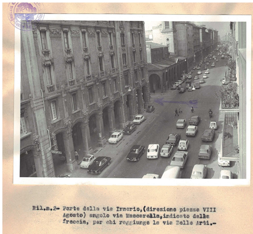
Ril.n.2- Parte della via Irnerio, (direzione piazza VIII Agosto) angolo via Mascarella, indicato dalla freccia, per chi raggiunge la via Belle Arti.-

Lo stesso giorno ed in quelli seguenti, il centro storico di Bologna diventa teatro di numerose manifestazioni di protesta.