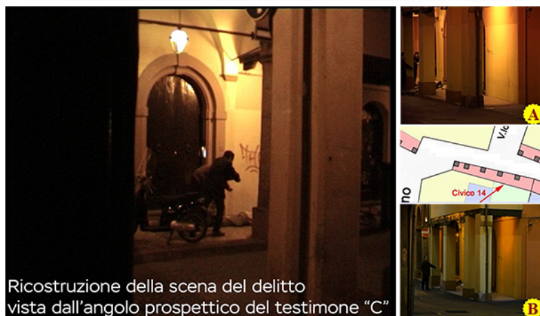
Ricostruzione della scena del delitto vista dall'angolo prospettico del testimone "C"

La Polizia Scientifica ha ricostruito in un filmato la dinamica dell'omicidio accertata dal pool investigativo.