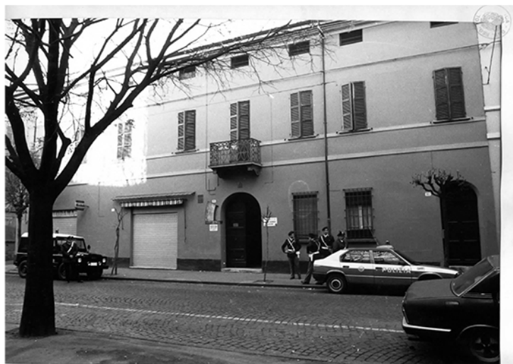
Ril.nr.1.-La facciata anteriore dello stabile contrassegnato dal civico 116 di Corso Diaz, in Forlì.-

Il 16 aprile 1988 un commando delle Brigate Rosse, dopo aver fatto irruzione nella sua abitazione di Corso Diaz a Forlì, uccide a colpi d'arma da fuoco il Senatore Roberto RUFFILLI.