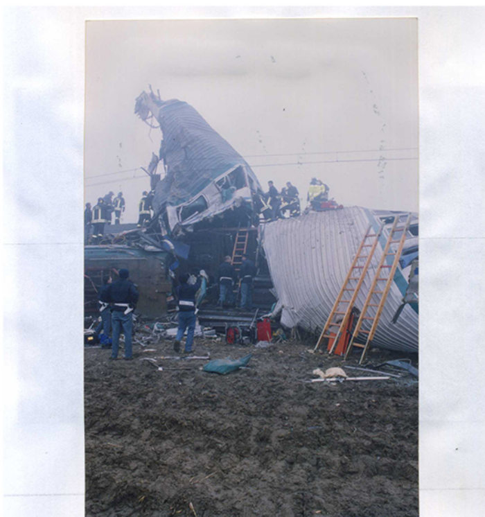
Ril.nr.32: Particolare di cui al rilievo precedente. ... di Bologna, panoramica del lato de